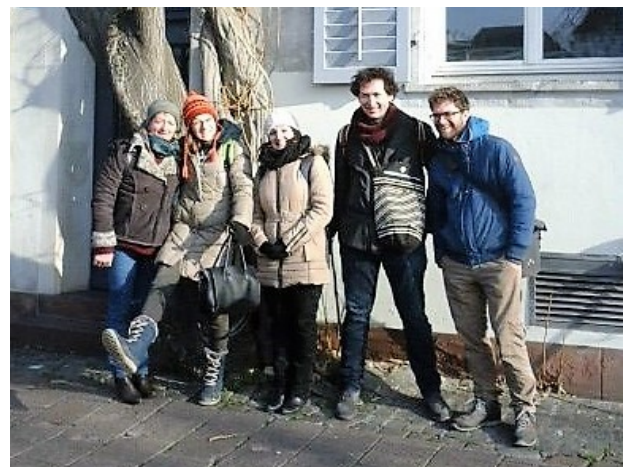
Die Mannschaft der "Austauschlehrkräfte" mit einigen Schülerinnen während der "Schatzsuche"!