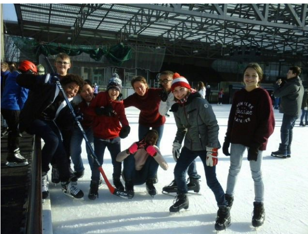
Schüler der Austauschklasse aus Mulhouse mit der Basler Klasse auf der Kunsteisbahn in Basel

Wir haben nämlich die Klasse aus Mulhouse am Dienstag, den 6. Februar 2018 in Basel empfangen. Wir haben sie am Vormittag in kleinen Gruppen eine "Schatzsuche" in der Altstadt mit Fragen auf Deutsch und auf Französisch machen lassen und am Nachmittag sind wir Schlittschuh fahren gegangen. Es war ein wunderschöner Tag. Zum Glück war die Sonne voll dabei. Am 19. April fahren wir nach Mulhouse die Oper für Jugendlichen "Sindbad" im Théâtre de la Sinne mit der Austauschklasse anzuschauen und besichtigen die Altstadt und ihre Schule. Längere Aufenthalte sind nächstes Jahr zu planen, entweder mit der ganzen Klasse oder individuell je nach der Motivation der Klasse.