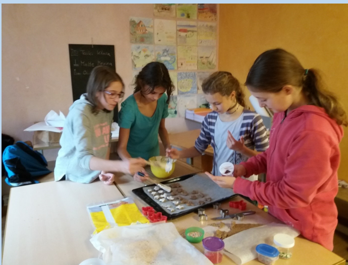
Kinder beim Backen im Französischunterricht

Bereits im September 2017 machten wir uns daran, Croque-monsieur und Früchtespieße zuzubereiten. Dies geschah aber ohne grosse Vorbereitung, da ich vor allem spüren wollte, ob es überhaupt möglich ist, mit 20 Schülern in einem Schulzimmer zu kochen. So war es nach einer Weile nicht mehr möglich, nur Französisch zu sprechen. Ich ging dazu über, Französisch und Deutsch zu sprechen. Es war trotzdem eine gute Erfahrung für alle und ich bemerkte, dass die Schüler die Erklärungen auf Französisch gut verstanden, wenn wir sie zeitgleich ausführten. Auch wusste ich nun, wie ich die Schüler für die nächste Backlektion vorbereiten wollte.